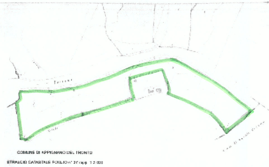
COMUNE DI APPENNINO DEL TRONTO STRALCIO CATASTRALE FORLÌ n° 27 fog. 12.000