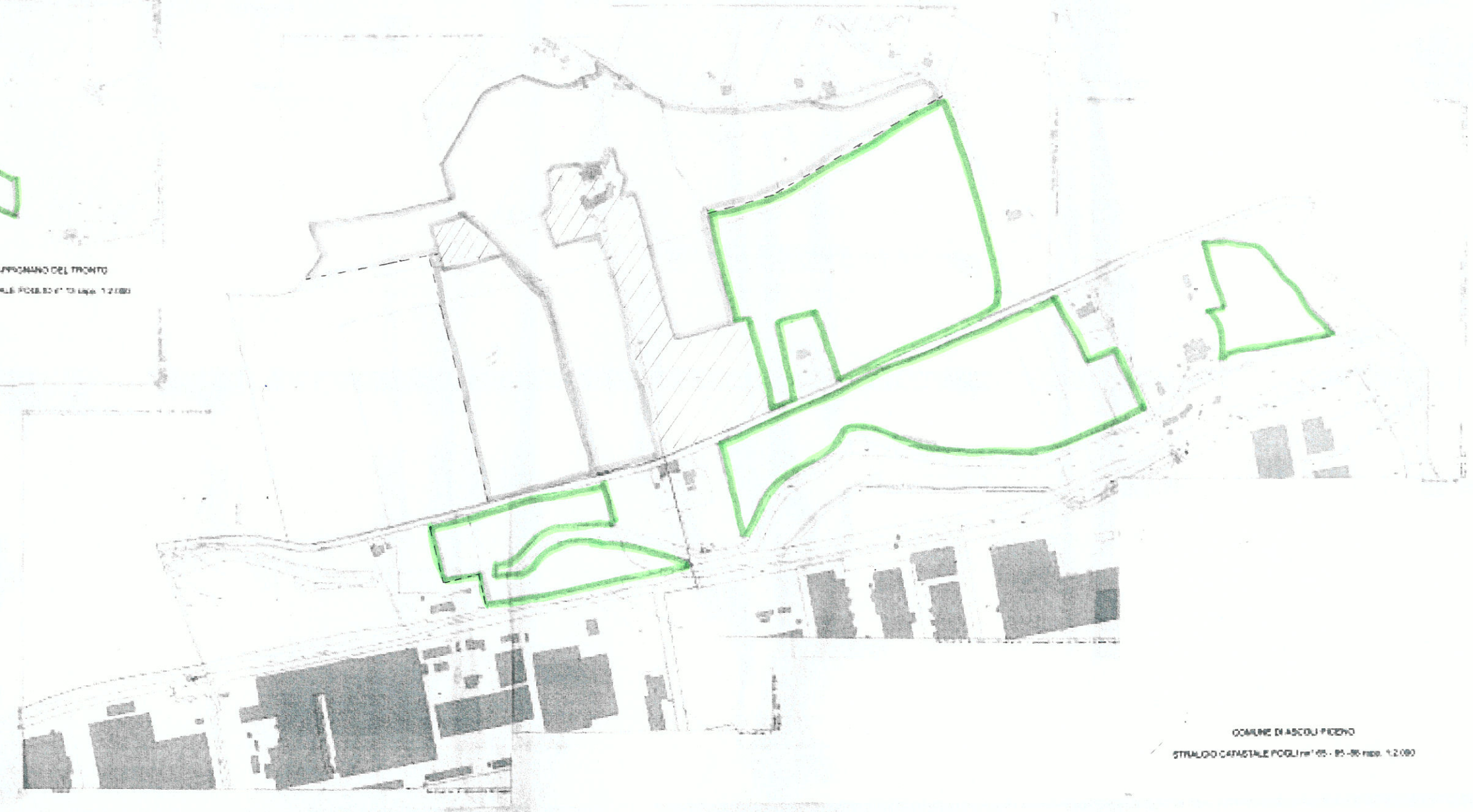
COMUNE DI ASCOLI PICENO STRALCIO CATASTRALE PUGLI n° 05 - 05 - 06 fog. 12.000