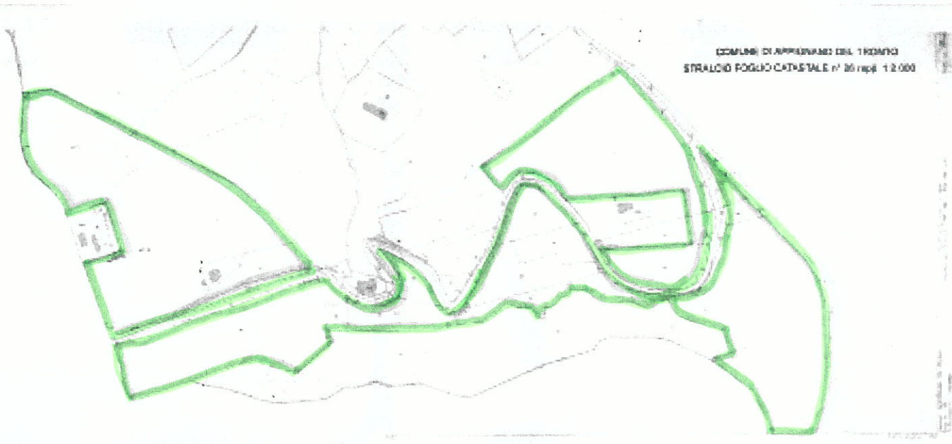
COMUNE DI APPENNINO DEL TRONTO STRALCIO CATASTRALE n° 26 fog. 12.000