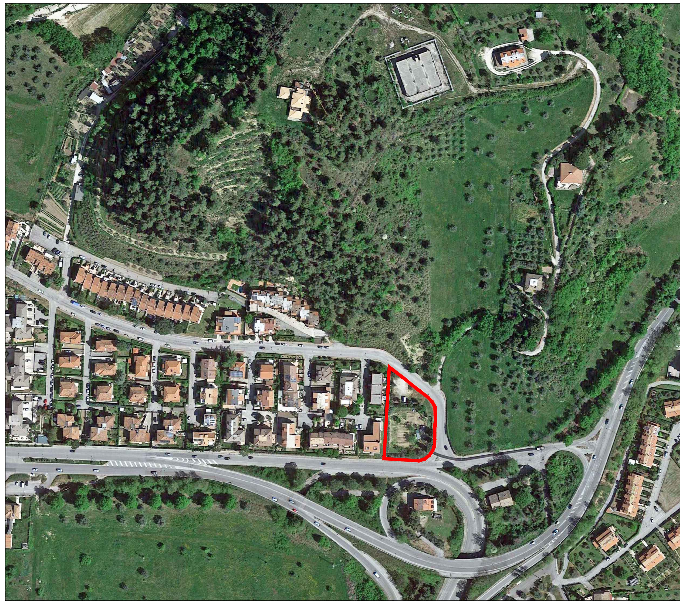
PLANIMETRIA Scala 1:2000