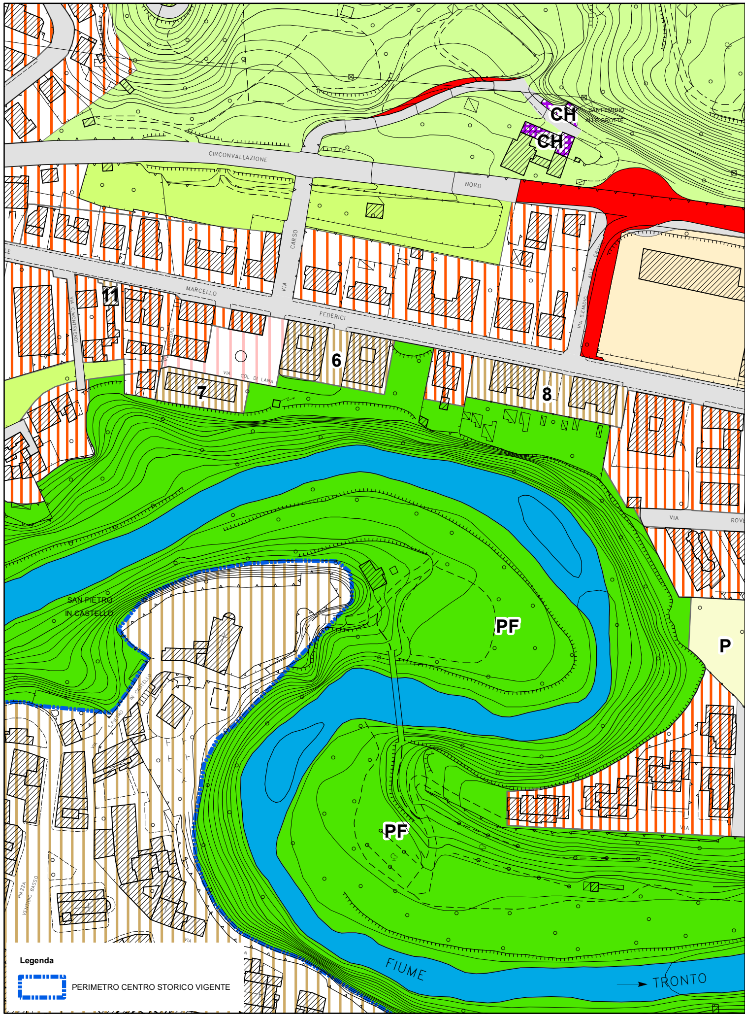
PIANO REGOLATORE GENERALE - ZONIZZAZIONE ATTUALE (APPR. DEL. C.C. N. 2 DEL 26-01-2016)