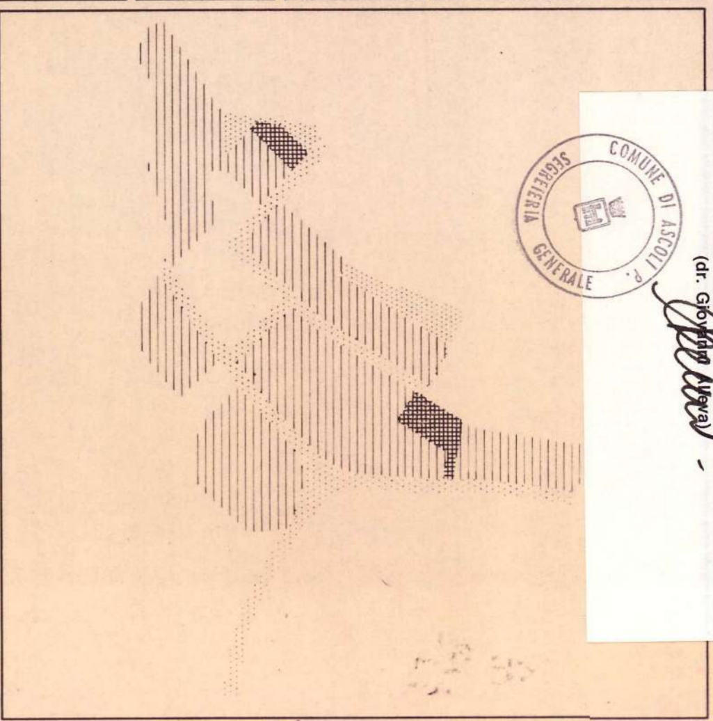
TAVOLA N. 8

PLAN. STATO ATTUALE SU BASE CATASTALE SCALA 1:500 15 SET. 1993