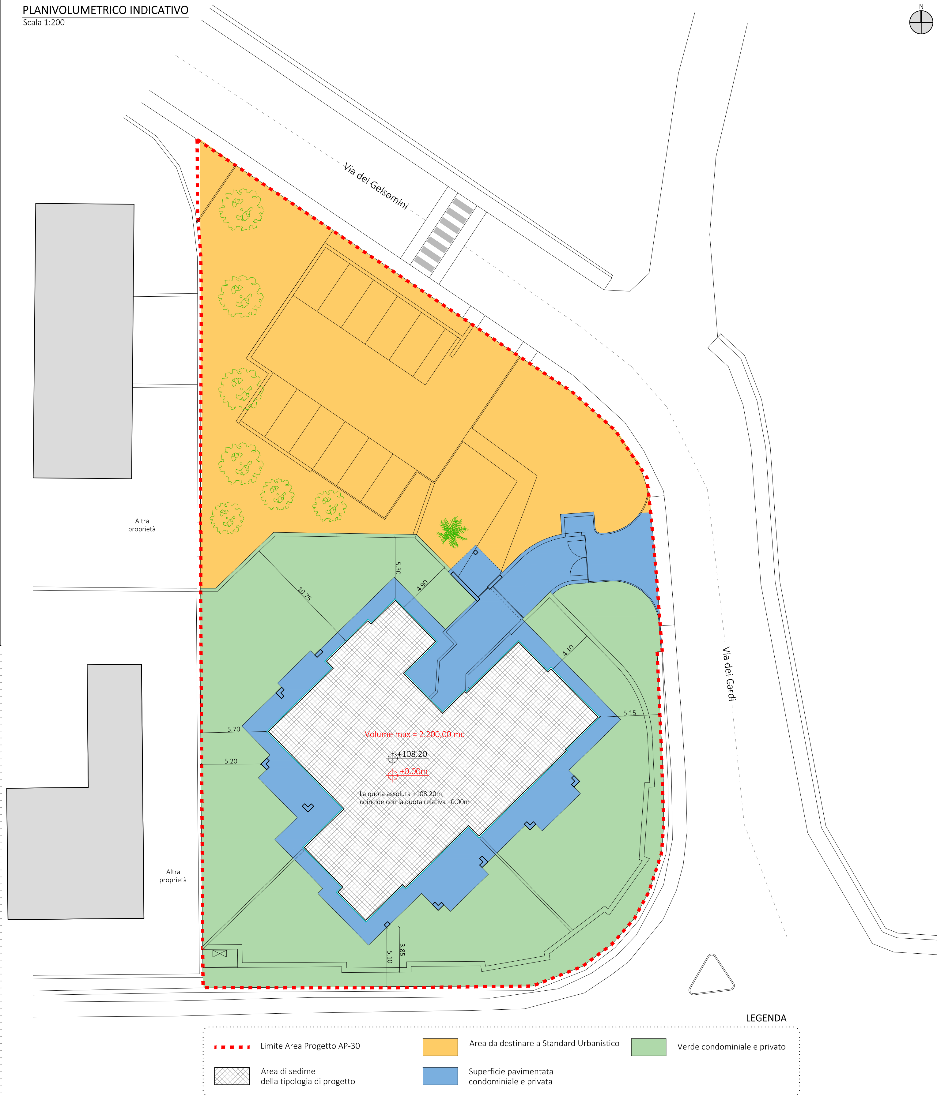
PLANIVOLUMETRICO INDICATIVO Scala 1:200