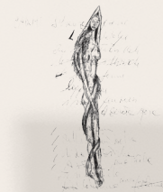
Fondazione Mauro Crocetta