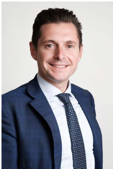
Il Sindaco Marco Fioravanti

Cari cittadini, il 2026 è alle porte e le sfide che ci prepariamo ad affrontare sono tante. La nostra città, negli ultimi dodici mesi, ha continuato a crescere e ad aprirsi all'esterno, grazie alle politiche che siamo riusciti a mettere in campo. L'obiettivo, per il nuovo anno, è insistere su questa strada e accelerare ulteriormente, per rendere Ascoli sempre più un riferimento dal punto di vista culturale, turistico e amministrativo. Le grandi partite della ricostruzione post sisma e della rigenerazione urbana vanno avanti, come pure quella delle opere: dopo corso Trento e Trieste, abbiamo deciso di continuare a investire nella riqualificazione del centro storico, con il restyling di Piazza Arringo. Un lavoro atteso da tempo e che porterà qualche inevitabile disagio, che cercheremo comunque di limitare. Sono sicuro che alla fine ne sarà valsa la pena, perché la piazza sarà ancor più bella e funzionale, e verrà ulteriormente valorizzata la sua vocazione di luogo di incontro e condivisione.