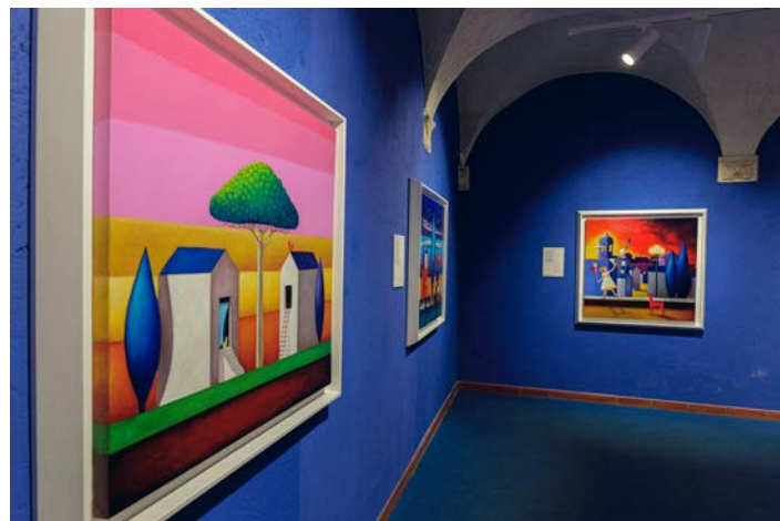
Turisti e visitatori hanno preso d'assalto i musei ascolani grazie anche alle tante esposizioni proposte