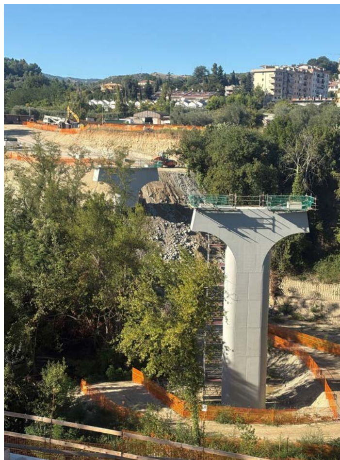
La struttura unirà Monticelli a Castagneti

Il cantiere del ponte sul fiume Tronto, che unirà le due sponde connettendo la zona di Castagneti a Monticelli, sta procedendo a ritmo sostenuto. Le opere di fondazione in alveo sono state completate e le travi dell'impalcato in acciaio corten sono in fase di montaggio. Sono state inoltre risolte le interferenze con i sottoservizi presenti nel punto di raccordo con Via del Commercio. Per minimizzare i disagi per il traffico, tema rispetto al quale l'Amministrazione ha promosso alcuni incontri pubblici con gli operatori economici della zona, le lavorazioni sono state frazionate e si sta procedendo alla realizzazione delle opere di contenimento, lato ferrovia, per la futura rotatoria che occuperà il piazzale a una quota inferiore (di un paio di metri) rispetto all'attuale. Gli interventi saranno svolti in orari notturni, in assenza di traffico ferroviario, per motivi di sicurezza imposti da RFI. La chiusura totale del traffico per gli sbancamenti dell'area è prevista dopo le festività natalizie. L'Amministrazione si è già attivata per la progettazione di un secondo lotto funzionale di lavori che prevederà un nuovo attraversamento della ferrovia, a una quota inferiore dell'attuale sottopasso, per permettere la fruizione della nuova viabilità a tutte le tipologie di veicoli.