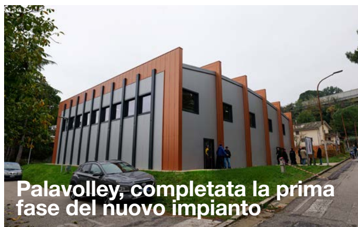
Palavolley, completata la prima fase del nuovo impianto

È stato inaugurato il Palavolley all'interno della Cittadella dello Sport, dopo il completamento del primo lotto funzionale dell'intervento. Il progetto, finanziato con risorse Pnrr per 990.000 euro e cofinanziato dal Comune con 150.000 euro, ha previsto un impianto a elevate prestazioni energetiche, con una copertura curvilinea ottenuta con una serie di portali in legno lamellare. Negli spazi interni è stato realizzato un campo da pallavolo omologato per la serie B, una tribuna da 95 posti e uno spazio servizi per il pubblico, allo stato grezzo nell'ambito del primo lotto funzionale. L'impianto è stato progettato per offrire una struttura di alta qualità per gli atleti e gli appassionati di pallavolo.