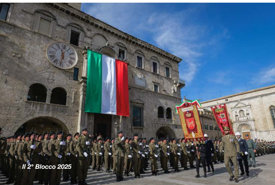
Il 2° Blocco 2025

Una cerimonia carica di emozioni si è svolta venerdì 31 ottobre in Piazza del Popolo, con la presenza del Ministro della Difesa, Guido Crosetto. Il Giuramento solenne dei volontari in ferma iniziale del 2° Blocco 2025 e la Giornata delle Medaglie d'Oro al Valor Militare hanno rappresentato un momento di celebrazione e di riflessione per la città e per le forze armate. La cerimonia, che ha visto la partecipazione di numerose autorità e di rappresentanze delle associazioni combattentistiche e d'arma, si è aperta con lo schieramento del Reggimento e gli onori ai Gonfalon, seguiti dall'ingresso dei labari e dagli onori alla bandiera di guerra. Il Comandante di Reggimento ha poi pronunciato un'allocuzione, seguita dall'intervento di un decorato di Medaglia d'Oro al Valor Militare e dalla lettura della formula di giuramento.