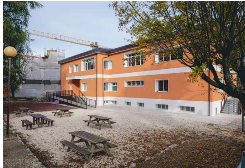
L'istituto rinnovato nel quartiere Tofare

Il cantiere alla primaria Don Giussani è pronto a partire, mentre a breve sarà indetta la gara per l'affidamento dei lavori della scuola infanzia San Marcello di via Sardegna. Un impegno costante per garantire strutture scolastiche moderne e sicure agli studenti di Ascoli Piceno.