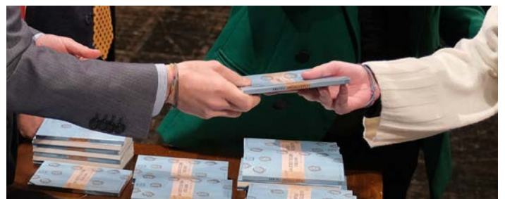
Una copia della Costituzione a chi ha compiuto 18 anni nel 2025

Tra le attività rivolte ai ragazzi rientra anche il progetto Skilup, finanziato dalla Regione Marche attraverso il bando "Gear Up". L'obiettivo principale dell'iniziativa è promuovere la consapevolezza e l'engagement dei giovani tra i 15 e i 30 anni sui temi della cittadinanza globale, attraverso azioni innovative di informazione e sensibilizzazione. Il progetto è realizzato con due partner qualificati: Apply Aps e AP Events Aps, associazioni del territorio con esperienza in educazione e comunicazione sociale.