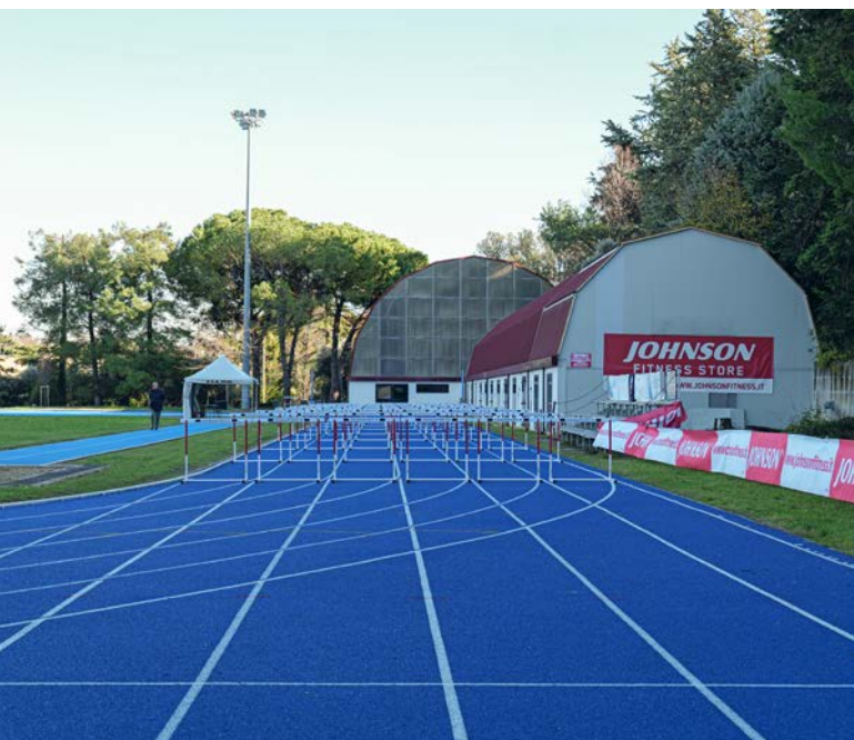
Rinnovati l'intera pista e il rettilineo della struttura indoor

È tornato a disposizione degli atleti e degli appassionati il campo scuola "Mauro Bracciolani", dopo il rifacimento della pista di atletica leggera. Il taglio del nastro è avvenuto sabato 29 novembre, alla presenza del Ministro dello Sport, Andrea Abodi, e delle società sportive che usufruiscono dell'impianto. I lavori, finanziati con risorse Pnrr per un importo complessivo di 660.000 euro, hanno riguardato l'intera pista e il rettilineo della struttura indoor. L'impianto ha ottenuto l'omologazione da parte della Fidal - Federazione Italiana di Atletica Leggera. Dopo 35 anni, il manto sintetico superficiale è stato oggetto di un completo rifacimento che ha garantito elasticità e funzionalità della pista. Il nuovo campo scuola va ad arricchire l'offerta impiantistica all'interno della Cittadella dello Sport "Carlo Vittori" di via De Dominicis, insieme al Palavolley.