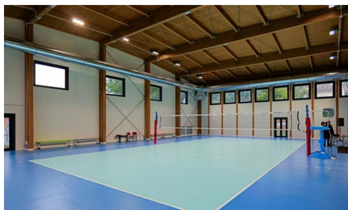
Il campo è omologato per la serie B

Nel frattempo, è già stato effettuato l'affidamento del secondo lotto funzionale, con 185.000 euro messi a disposizione dall'Arengo, insieme all'utilizzo delle economie di gara per lo stesso importo autorizzate dalla Presidenza del Consiglio dei Ministri - Dipartimento dello Sport. Con questi fondi, si procederà al completamento del blocco dei bagni per il pubblico e alla realizzazione della nuova struttura destinata agli spogliatoi, al fine di completare l'offerta dell'impianto e renderlo sempre più funzionale e accogliente.