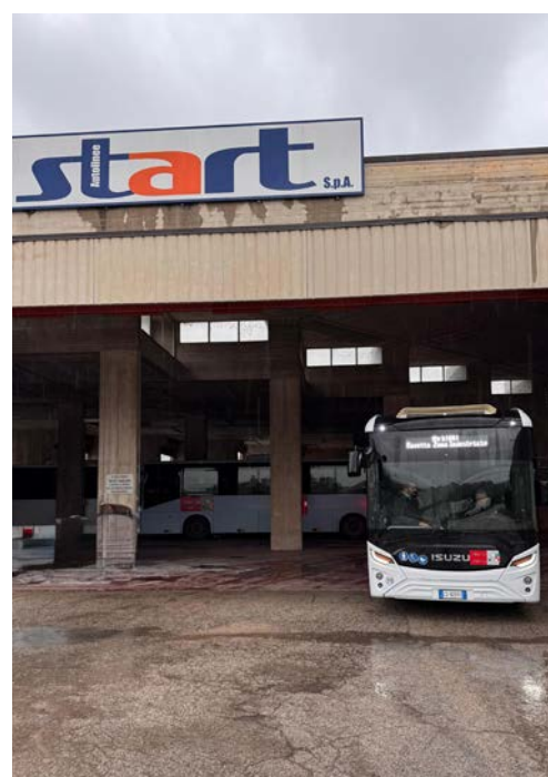
La navetta è prenotabile tramite un'app dedicata

Novità in arrivo anche per le navette gratuite che collegano al centro storico. Da gennaio verrà modificato il loro percorso, per garantire una migliore e più celere fruizione del servizio, prevedendo l'attraversamento di corso Trento e Trieste in direzione nord-sud. L'impegno verso una mobilità sempre più sostenibile è stato certificato anche dalla candidatura del Comune di Ascoli Piceno alla nona edizione del premio Urban Award, il riconoscimento rivolto ai Comuni che nasce dall'esigenza di innescare una gara virtuosa tra città sui progetti di mobilità sostenibile che possano concretamente portare i cittadini a preferire altri mezzi di trasporto rispetto all'automobile.