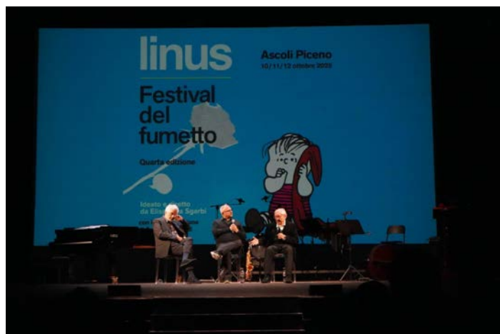
Grandi ospiti sotto le Cento Torri