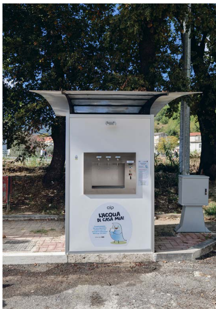
La casetta si trova nei pressi della chiesa

Il Comune di Ascoli e la Ciip, nell'ottica di potenziare i servizi idrici pubblici e di sensibilizzare a un corretto uso della risorsa, hanno recentemente inaugurato una nuova casetta dell'acqua, a Brecciarolo. In questo modo, i cittadini potranno avere a disposizione acqua filtrata, naturale e frizzante, a prezzo calmierato.