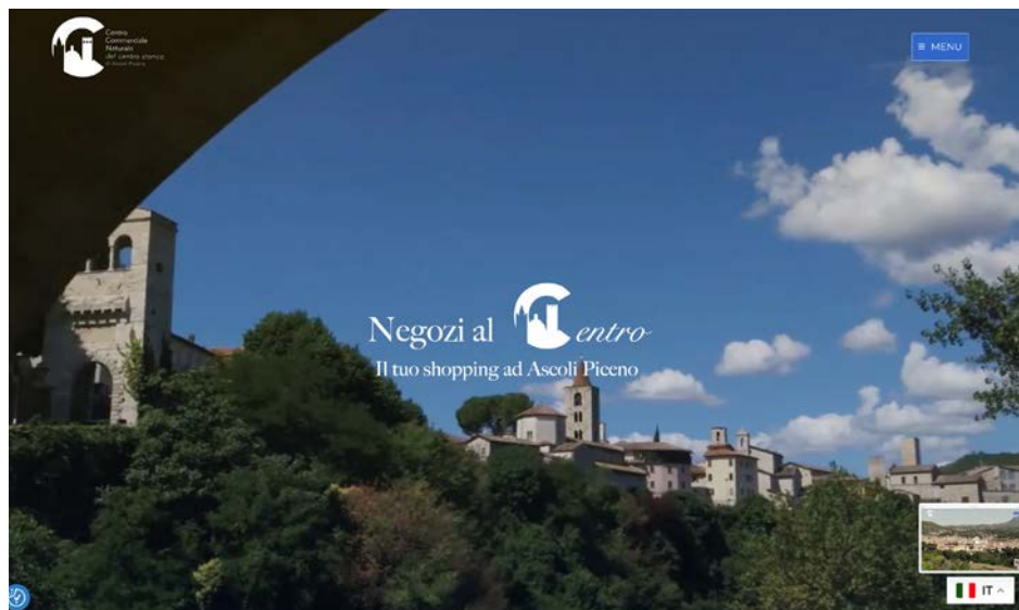
L'homepage del portale dedicato al progetto

Le attività economiche aderenti potranno contare su una propria vetrina virtuale e migliorare la loro visibilità attraverso campagne di comunicazione unitarie, percorsi di shopping tematici e itinerari esperienziali. Una forma di collaborazione innovativa tra il Comune, le associazioni di categoria e i titolari delle attività economiche, che favorirà la promozione e la diffusione delle informazioni sulle offerte e sulle sconti dei vari negozi.