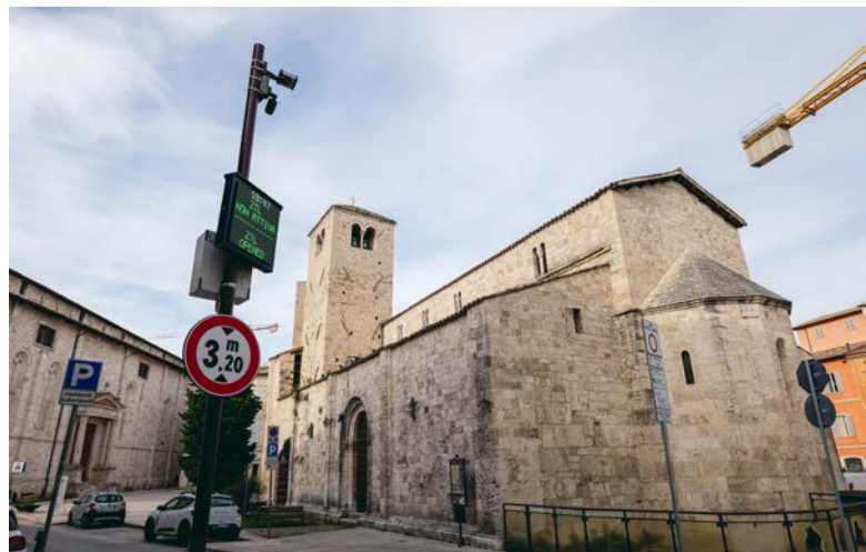
Il nuovo varco in Piazza Ventidio Basso