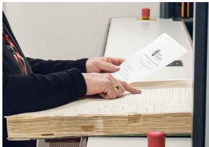
Un importante passaggio verso il digitale

Un piano che ha già dato i suoi frutti, con l'inserimento di nuove professionalità in vari settori: sei istruttori amministrativi, sei agenti di polizia locale, un istruttore tecnico, quattro commessi di farmacia, due istruttori informatici (con manifestazione di interesse), un collaboratore amministrativo, due funzionari assistenti sociali (stabilizzazioni), un funzionario tecnico, una mobilità (assistente sociale) e diverse progressioni di carriera.