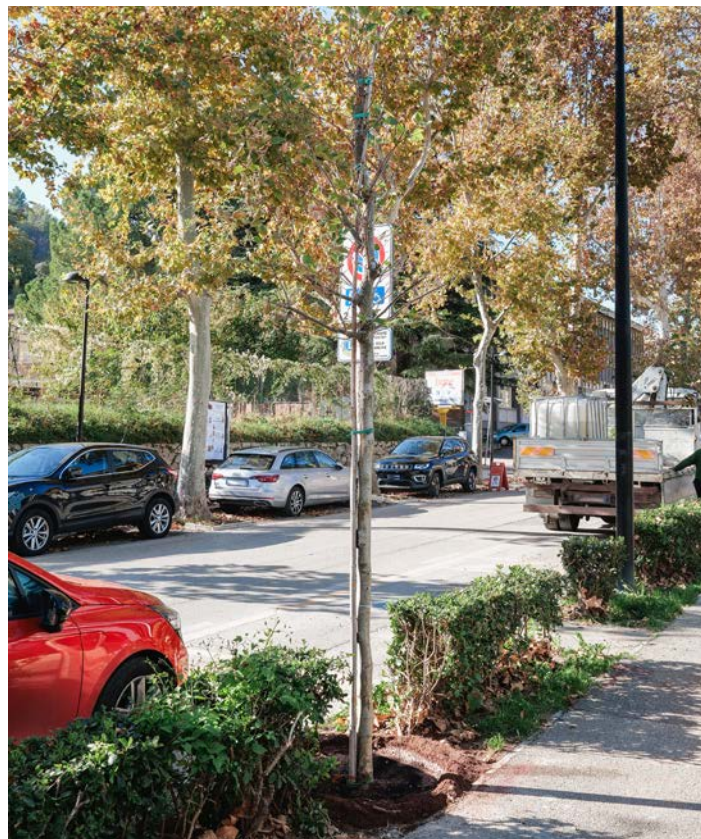
Più verde in molte zone della città

Già nei primi mesi del 2025 era stata avviata la piantumazione delle piante mancanti in Viale Indipendenza e ora l'attività è ripresa con un nuovo lotto di interventi: in viale Vellei 16 abbattimenti e 17 nuovi impianti di ippocastano sterile "Baumannii"; in via Piave 13 abbattimenti e 16 nuovi impianti di platano; in viale Indipendenza 31 abbattimenti, 38 nuovi tigli e 28 nuovi esemplari tra Albero di Giuda e Lagerstroemia; in viale Benedetto Croce un abbattimento e un