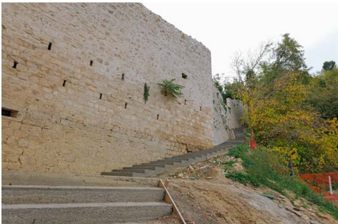
Un nuovo percorso turistico fino alla Fortezza

Parallelamente, procede il recupero del camminamento da Porta Gemina alla Fortezza Pia, grazie al restauro della cinta muraria, che includerà l'illuminazione e la videosorveglianza del percorso a piedi. L'obiettivo è di valorizzare l'area e renderla più fruibile per residenti e visitatori, potenziando l'offerta turistica e culturale del quartiere.