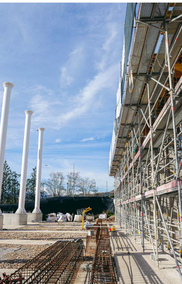
Completate le opere di fondazione

Le opere di fondazione, comprensive di pali trivellati e travi di collegamento in calcestruzzo armato, sono state completate. Sono state inoltre effettuate le opere di carpenteria per l'elevazione, comprendenti pilastri e setti in cemento armato, attualmente in fase di realizzazione. Infine, sono in corso di esecuzione le opere di carpenteria metallica necessarie per il successivo montaggio della struttura in acciaio.