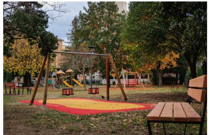
Lavori su arredo urbano, giochi per bambini e verde

due di Sophora japonica, sottoposti a potatura attenta e mirata, e alle altre specie arboree e arbustive, che hanno beneficiato di una potatura di rimonda del secco e di riforma/contenimento delle chiome. L'Amministrazione si è inoltre concentrata sul miglioramento della fruibilità del parco grazie a una nuova recinzione, all'implementazione dell'area giochi, a una migliore illuminazione, alla realizzazione di un percorso brecciato, agli interventi di gestione del prato mediante il potenziamento della gramigna, per un manto erboso più denso, e a nuovi arredi urbani. Oltre alla potatura di alberi e arbusti, è stato realizzato un percorso brecciato all'interno del parco, che consentirà di avere una zona sempre asciutta e tale da permettere comunque un'agevole fruizione. Sul lato nord è stata sostituita la recinzione esistente, mentre sui lati sud ed est lo stesso lavoro è stato effettuato sulla ringhiera, oltre al ripristino dei cancelli esistenti. Sono state sostituite due altalene e la torre gioco e ne è stata installata una in più nella zona est del parco. Inoltre, per garantire la massima sicurezza, è stata posizionata la nuova pavimentazione antitrauma. È stato rinnovato interamente l'arredo urbano, con nuove panchine, cestini e aree picnic, e migliorato l'impianto di illuminazione con nuovi pali e la sostituzione di tutte le lampade esistenti. I lavori sono stati realizzati nell'ambito del Programma "Riabitare i Parchi", finanziato con fondi Pnrr Pinqua.