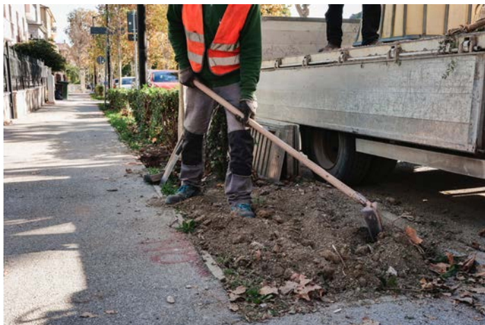
Le piantumazioni in viale Treviri