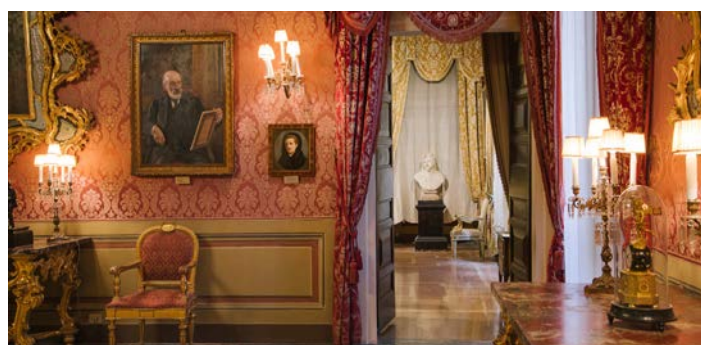
Il trend di visitatori è in costante ascesa

I musei civici hanno registrato nel 2025 risultati lusinghieri e una crescita costante dell'affluenza di pubblico. Numerose mostre, iniziative artistiche ed eventi culturali hanno caratterizzato l'anno in corso, attirando visitatori da tutta la regione e non solo. I dati parlano chiaro: nel 2019, anno pre-Covid, gli ingressi erano stati 15.167. Dopo il calo dovuto alla pandemia, dal 2022 il trend è stato sempre in crescita: 15.869 ingressi, poi 19.505 nel 2023, 30.257 l'anno successivo. E il 2025 si chiuderà sicuramente con un altro record, visto che a fine ottobre le presenze erano già 29.354. La crescita è stata costante in gran parte dei mesi, con incrementi anche molto consistenti come registrato - ad esempio - a febbraio 2025 (+80,30%), luglio e ottobre (quasi +70%). Un risultato che premia l'impegno e la dedizione del personale dei musei e che conferma l'importanza di questi spazi come motore culturale e sociale della città.