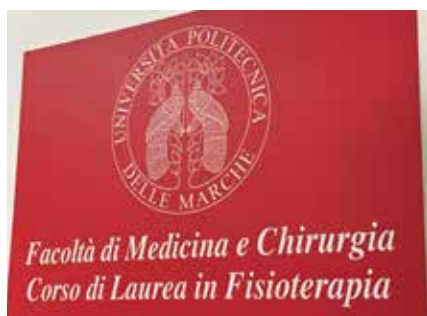
Corso attivato all'ospedale Mazzoni.