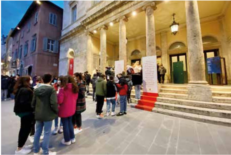
L'anteprima de 'La bohème' dedicata agli studenti.

La lirica si prende la scena e torna a riempire il teatro Ventidio Basso. 'Rigoletto. I misteri del teatro' e 'La bohème' sono state un successo e anche 'L'italiana in Algeri', in programma il 19 febbraio,