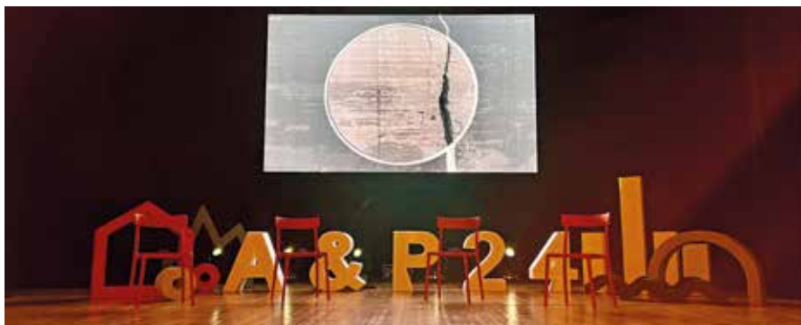
La candidatura illustrata alla cittadinanza.