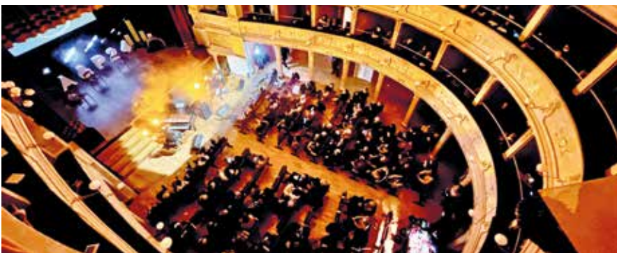
La presentazione al Teatro dei Filarmonici.

ee interne, in cui il contesto urbano abbandona la sua autoreferenzialità e si apre a un dialogo di area vasta. Vuole quindi essere un processo in grado di fondere il ricco patrimonio ereditato dal passato con le sfide della contemporaneità, sperimentando nuove pratiche co-generative, partecipate e interdisciplinari. Il percorso che ha portato alla definizione del dossier ha coinvolto 173 realtà tra enti pubblici, Terzo settore, operatori turistici, enti formativi e organizzazioni del settore culturale, e si è snodato attraverso 79 incontri di progettazione partecipata e otto riunioni del comitato tecnico-scientifico. Il documento finale si fonda su quattro elementi di discontinuità nel sistema culturale: territorio, governance, tecnologie abilitanti e phygital, produzione e contemporaneità. Un progetto dall'orizzonte temporale più ampio del 2024, che guarda fino al 2030 e si articola su cinque temi che compongono il palinsesto culturale, a sua volta strutturato in 61 iniziative. Una lunga lista di eventi che coinvolgeranno città-