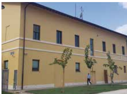
La nuova sede di Agraria.