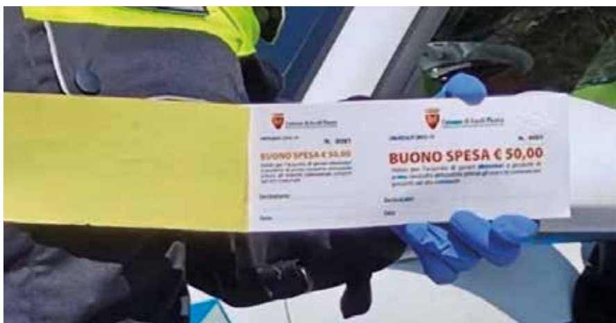
Buoni spesa per aiutare le famiglie.