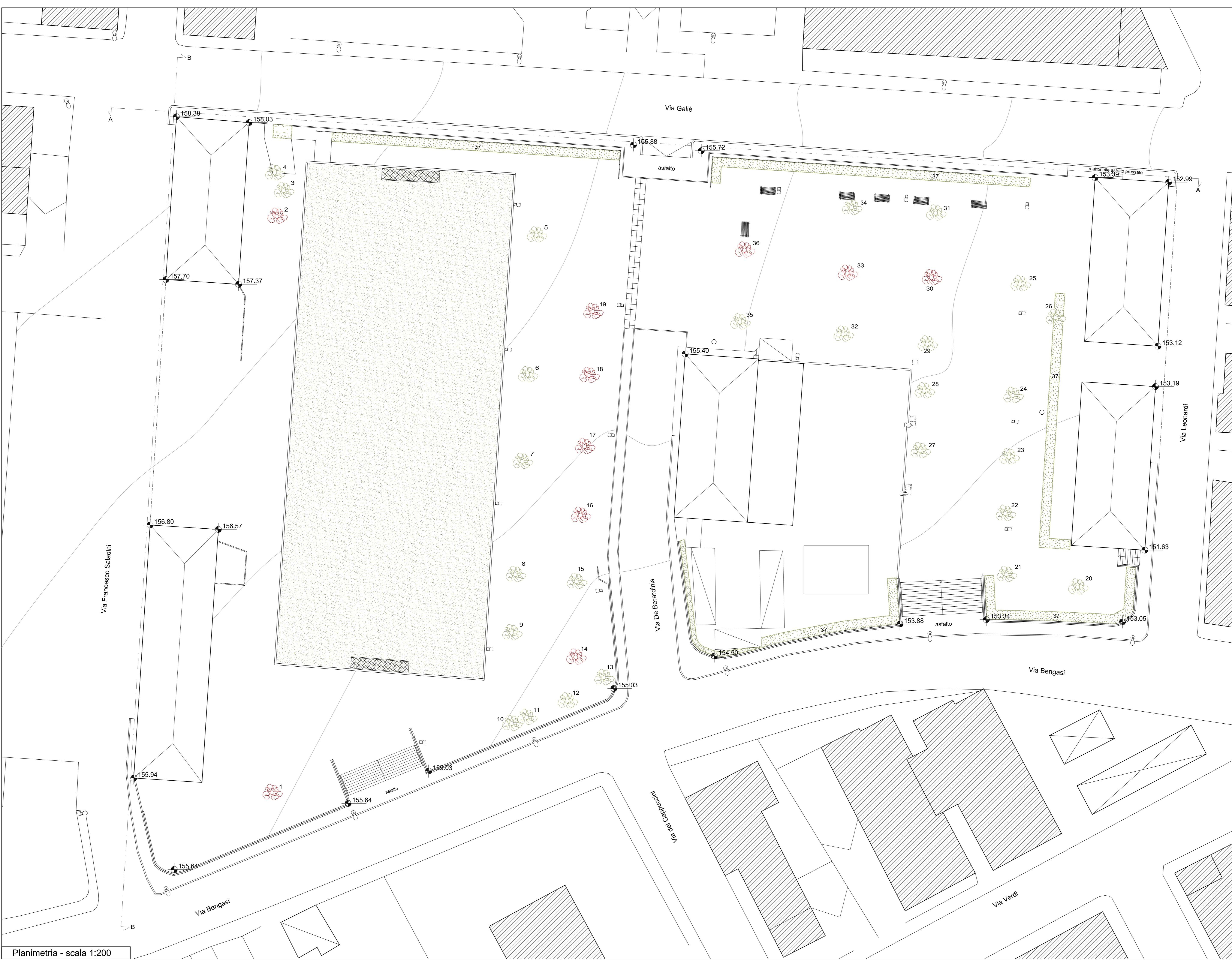
Planimetria - scala 1:200