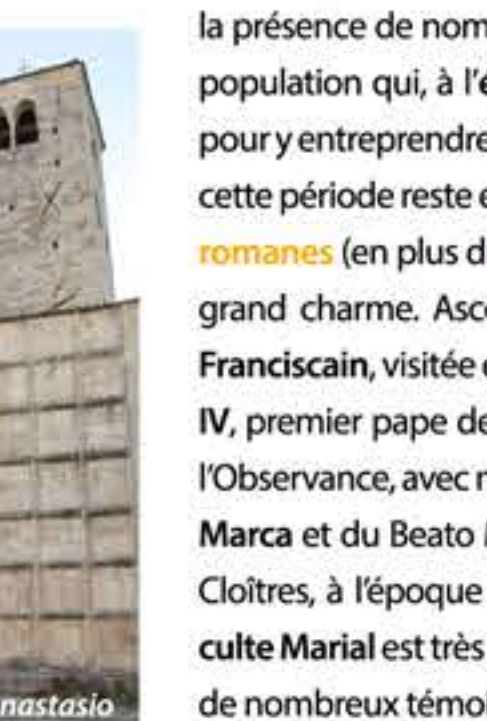
Chiesa dei Santi Vincenzo e Anastasio

Sant'Emidio , premier évêque d'Ascoli, est le patron de la ville et protecteur contre les tremblements de terre. Martyrisé en 303 apr.J.-C. on le fête le 5 Août avec des événements et des feux d'artifice. On lui a dédié la Cathédrale de Piazza Arringo , bâtie probablement au Ve siècle, ainsi qu'une série de fresque et de nombreux lieux d'intérêt spirituel comme le Tempietto di Sant'Emidio Rosso (Petit Temple de Sant'Emidio Rosso), bâti sur le lieu de sa décapitation, et Sant'Emidio alle Grotte , où il a été enterré. L'aménagement de la ville médiévale ascoline est caractérisé par la présence de nombreux lieux de culte liés à la croissance de la population qui, à l' époque communale , se déplaça vers la ville pour y entreprendre des activités artisanales et commerciales. De cette période reste encore aujourd'hui un noyau de seize églises romanes (en plus du Baptistère ), qui représente un itinéraire de grand charme. Ascoli a été la terre d'élection du mouvement Franciscain , visitée en 1215 par Francesco. Ville natale de Nicolas IV , premier pape de l'Ordre (1288 - 1292), elle fut le berceau de l'Observance, avec notamment les figures de San Giacomo della Marca et du Beato Marco . On peut encore visiter les splendides Cloîtres, à l'époque annexés au Couvent de San Francesco . Le culte Marial est très répandu à Ascoli. Il a laissé ses traces à travers de nombreux témoignages artistiques depuis le Moyen Âge.