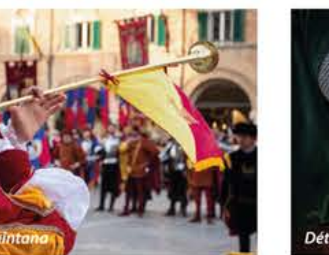
Détail défilé Quintana