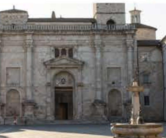
Fontana (Fontaine) dei Coni

La réalité d'une ville d'art n'est pas faite seulement de grands et importants monuments. Le visiteur peut souvent trouver des traces significatives de la culture d'un lieu dans des détails curieux qui dévoilent les secrets d'un ancien style de vie. Ascoli est vraiment très riche en petites particularités et il vaut la peine de les chercher pour mieux comprendre, en dehors de l'histoire, les petits événements de la vie quotidienne. Des exemples sont les angles arrondis des palais facilitant le passage des carrosses, les petites portes des habitations d'origine du Moyen Âge dites " du mort " et les colonnettes qui sonnent sur le portail principal de l' Église de San Francesco .