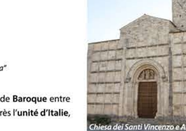
Chiesa dei Santi Vincenzo e Anastasio

La beauté et le nombre d'édifices et de chef-d'œuvres réalisés pendant la période Baroque entre 1600 et 1700, rendent la ville très intéressante. Devenue chef-lieu de Province après l' unité d'Italie , Ascoli a produit des nouvelles œuvres dans le goût éclectique de l'époque.