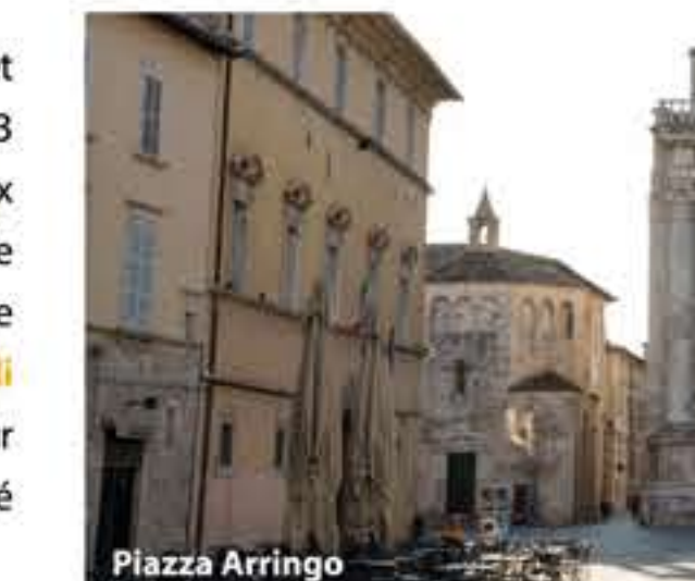
Teatro Ventidio Basso

Ascoli fut le siège d'un théâtre depuis l' époque romaine , mais ce ne fut qu'à la moitié du XVIe siècle qu'une véritable tradition théâtrale commença. Très intéressant est le Théâtre Ventidio Basso , le Théâtre des Filarmonici et les autres lieux de la ville destinés aux représentations publiques. Ascoli Piceno peut se définir un musée à ciel ouvert pour ses monuments fascinants bien conservés et pour les nombreuses œuvres d'art visibles simplement en se promenant dans le centre historique. Toutes les découvertes et les œuvres récupérées sont exposées dans les nombreux musées et archives historiques de la ville. Il faut visiter la Pinacothèque municipale , le Musée Archéologique National , le Musée diocésain , le Musée de l'Haut Moyen Âge , le Musée de la Papeterie Papale , la Galerie d'Art "Osvaldo Licini" , le Musée de l'art majolique , la Bibliothèque municipale et les Archives Nationaux .