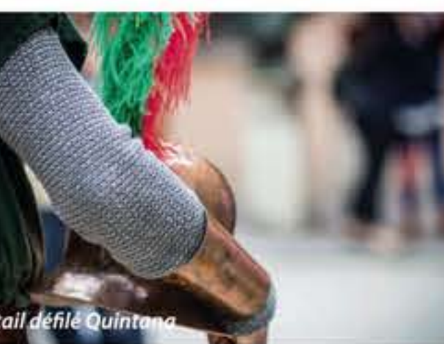
Détail défilé Quintana

Un des événements majeurs liés à la tradition du Moyen Âge est certainement la Joute de la Quintana , une révocation historique de cortèges et de tournois chevaleresques qui anime chaque année les rues de la ville. Divisé en sextiers (six quartiers), le centre historique revit le passé à travers des cérémonies et des rituels; les 1500 figurants traversent les étroites ruelles et les rues principales en défilant avec des costumes de l'époque pour atteindre le Campo Squarcia , pour l'occasion Terrain des jeux, pour acclamer le chevalier vainqueur de la Joute. Cette manifestation a lieu en mi-juillet dans l'édition nocturne et le premier dimanche du mois d'Août.