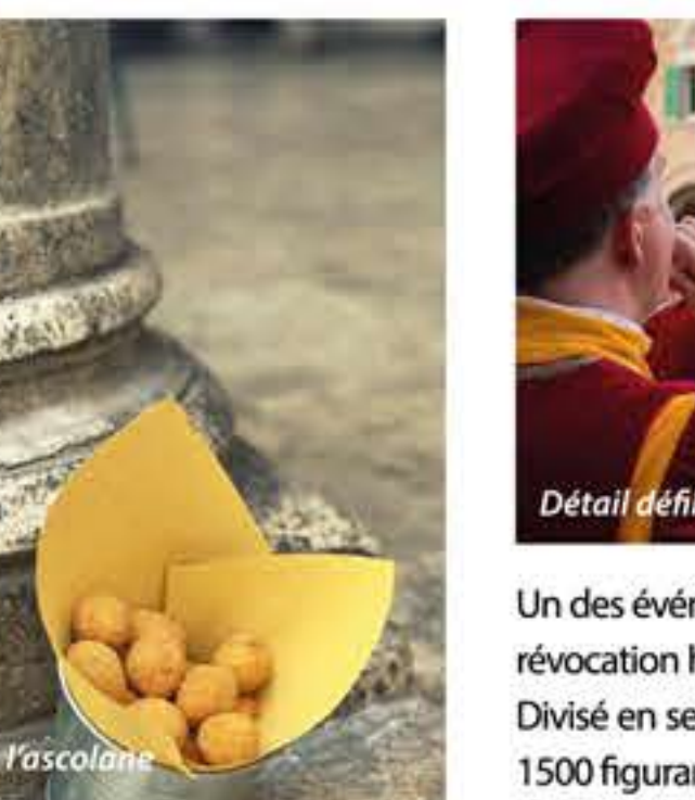
Olives à l'ascolaine

Une fête qui concerne toute la communauté est le Carnaval . Dans l'extraordinaire cadre de Piazza del Popolo , décorée de grandes lustres de la fin de siècle dernier, se tient le Carnaval d'Ascoli: les protagonistes en sont les habitants eux-mêmes, qui spontanément, avec les moyens les plus bizarres et insolites, en suivant en cela la Commedia dell'Arte, s'adonnent à des joyeuses mascarades, qui constituent une parodie ironique et subtile des événements de la vie.