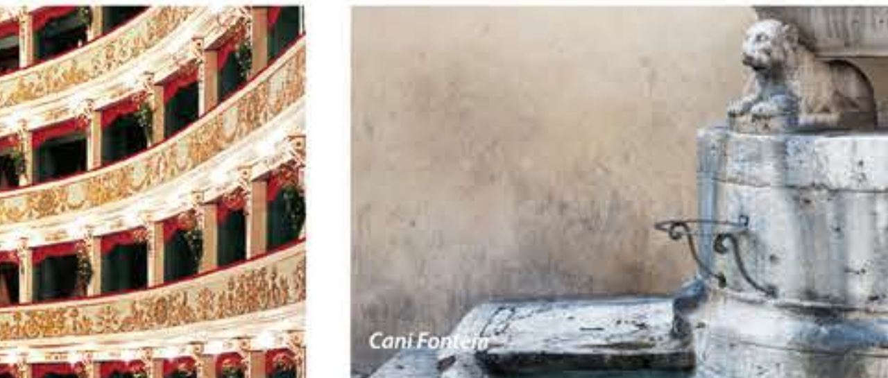
Fontana del Leone

De ziel van een kunststad wordt niet alleen gevormd door de grote en belangrijke monumenten maar ook door de details die geheimen blootleggen van een antieke levensstijl. Ascoli heeft een rijkdom aan kleine bijzonderheden die de moeite waard zijn te zoeken om naast de geschiedenis ook de kleine verhalen uit het dagelijks leven van toen te begrijpen. Enkele voorbeelden zijn de ronde hoeken van paleizen waarmee men vroeger de rit in een koets kon veraanagenamen, de kleine deuren in de oorspronkelijk middeleeuwse woningen die "van de dode" genoemd werden en de zuiltjes die luiden boven de hoofdingang van de Chiesa (kerk) di San Francesco.