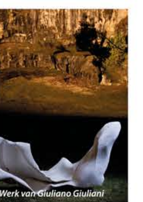
Werk van Giuliano Giuliani

Het historische centrum van Ascoli Piceno is heel harmonisch en consistent dankzij het gebruik van travertijn (kalksteen) dat sinds het ontstaan van de stad het belangrijkste materiaal in de constructie van de vele en diverse gebouwen is. Van eenvoudige woningen tot ambitieuze bouwwerken en herenhuizen en van kerken tot de bestrating van de pleinen, deze steensoort is al tweeduizend jaar, ondanks stijlveranderingen in de loop van de geschiedenis, het 'stadsweefsel' van Ascoli Piceno, hetgeen de stad zo uniek maakt.