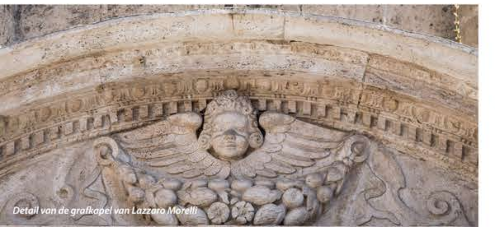
Detail van de grafkapel van Lazzaro Morelli