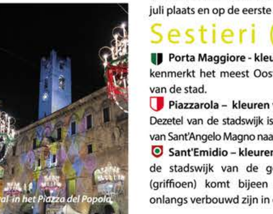
Carnaval in het Piazza del Popolo