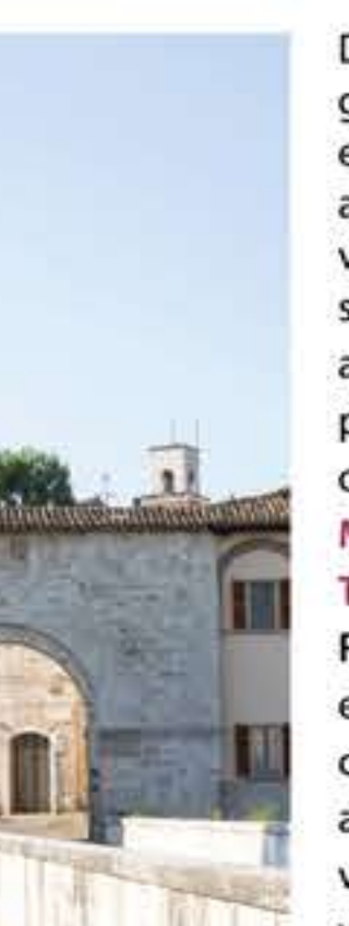
De Brug Augusteo

Het middeleeuwse Ascoli telde maar liefst tweehonderd adellijke torens voordat Federico II er in 1242 negentig van liet verwoesten. Tegenwoordig kan men er nog ongeveer vijftig van ontdekken, ook al zijn de meesten tot kleinere proporties teruggebracht en verwerkt in de woningen en zijn er twee van getransformeerd tot klokkentorens van kerken. De moeite waard om te bezoeken is het pad in de via (weg) delle Torri tot aan de via dei Soderini en de romantische rua (straat) delle Stelle, beter bekend als "Rrete li mierghie".