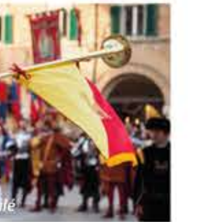
Detail van het Quintana defilé