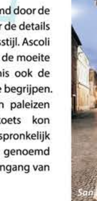
San Francesco Poort