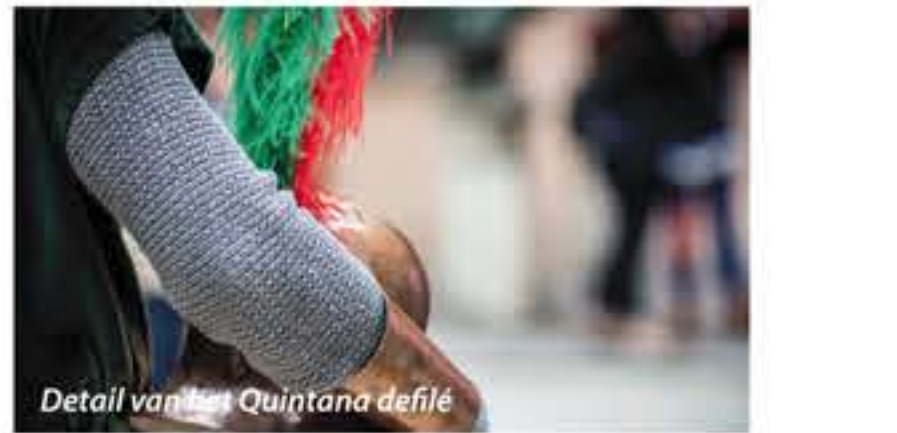
Detail van het Quintana defilé

Eén van de grootste evenementen verbonden met de middeleeuwse traditie is zonder twijfel het Glostra (steekspel toernooi of carousel) della Quintana , een historische herleving van hoven en riddertoernooien die vandaag de dag nog de straten van de stad bezielen. Verdeeld in zes sestieri (stadswijken) herbeleeft het historische centrum het verleden middels ceremonies en rituelen; de 1500 figuranten gaan gekleed in de klederdracht van weleer de nauwe straten en hoofdwegen door tot ze het Campo (veld) Squarcia bereiken dat voor de gelegenheid als speelveld dient, om de winnende ridder van het toernooi uit te roepen. Deze manifestatie vindt in de nachtelijke editie half juli plaats en op de eerste zondag van augustus.