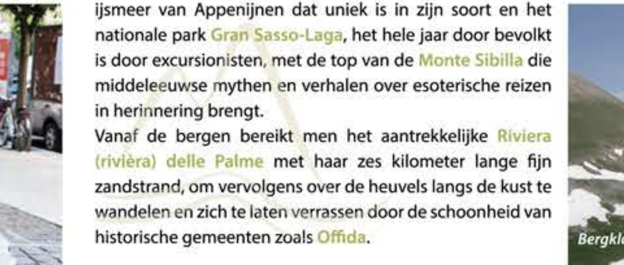
Bergkloof van de Monte Vettore

De antieke via (weg) Salaria is ongetwijfeld een aanrader die de centrale Appenijnen doorkruist en Ascoli met Rome verbindt. Zijdelings kan men de taveernes van veleer bezoeken, de antieke zoutpannen en de Romaanse kerken die zich langs de straat bevinden. Tussen het reliëf ten Noorden van Ascoli wordt het landschap gekenmerkt door de Monte Ascensione berg en indrukwekkende erosiegeulen. Wanneer men het traject volgt van de bergstroom Castellano komt men het prachtige antieke dorpje Castel Trosino tegen, belangrijk vanwege de vondsten uit de Longobardische tijd. Het landschap is uniek door de Montagna (berg) dei Fiori, de Monte Piselli en de Colle (heuvel) San Marco, een toeristisch ontmoetingspunt voor de inwoners. Noemenswaardig zijn de rondom aanwezige Nationale Parken. Het Nationale Park van de Sibellini met de top van de Monte Vettore die de 2000 meter overstijgt, het Pilato meer, het ijsmeer van Appenijnen dat uniek is in zijn soort en het nationale park Gran Sasso-Laga, het hele jaar door bevolkt is door excursionisten, met de top van de Monte Sibilla die middeleeuwse mythen en verhalen over esoterische reizen in herinnering brengt. Vanaf de bergen bereikt men het aantrekkelijke Riviera (riviera) delle Palme met haar zes kilometer lange fijn zandstrand, om vervolgens over de heuvels langs de kust te wandelen en zich te laten verrassen door de schoonheid van historische gemeenten zoals Offida.