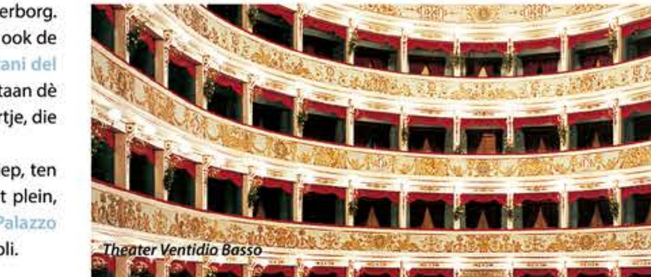
Theater Ventidio Basso

Ascoli heeft tot de Romeinse tijd een theater gehad maar sinds halverwege de zestiende eeuw is de eigen theatertraditie pas tot volle wasdom gekomen. Met name het Teatro (theater) Ventidio Basso, het Teatro dei Filarmonici en een aantal andere ruimtes bestemd voor publieke voorstellingen zijn noemenswaardig. Ascoli Piceno kan een openluchtmuseum genoemd worden door haar fascinerende, goed onderhouden monumenten en door de talloze kunstwerken die men er kan bewonderen wanneer men door het oude centrum wandelt. Alle ontdekkingen en vondsten worden in de talrijke musea en historische archiefplaatsen in de stad tentoongesteld. Aanraders zijn de Pinacoteca Civica (Stadmuseum voor schilderkunst), het Museo Archeologico Statale (Rijksmuseum voor Archeologie), het Museo Diocesano (Pastoraal Museum), het Museo dell'Alto Medioevo (het Museum voor de hoge middeleeuwen), het Museo della Cartiera Papale (Museum van de pauselijke papierfabriek), de Galleria d'Arte "Osvaldo Licini" (Kunstgalerie "Osvaldo Licini"), het Museo dell'Arte Ceramica (Museum Keramische Kunst), de Biblioteca Comunale (Gemeentebibliotheek) en het Archivio di Stato (Staatsarchief).