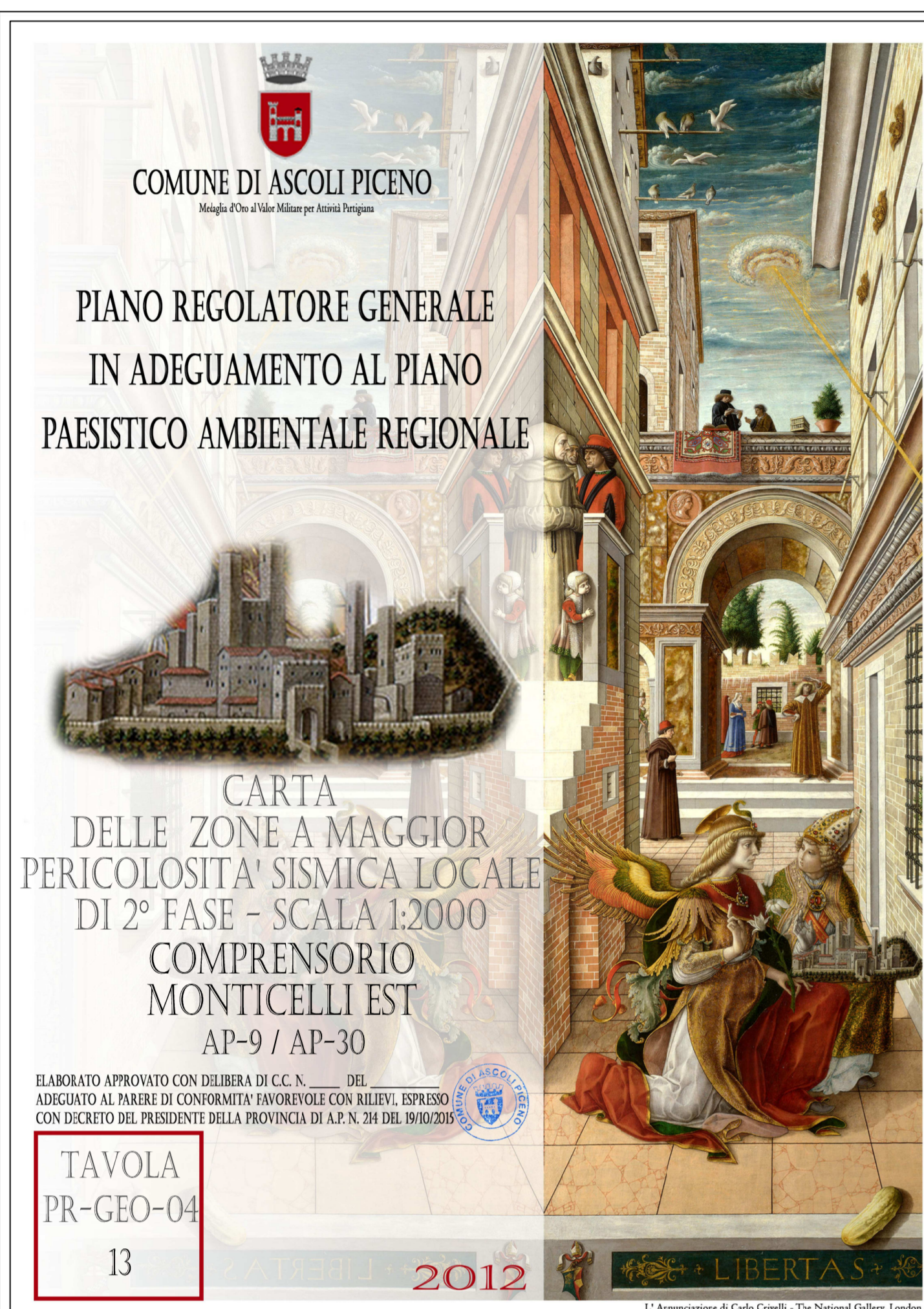
CARTA DELLE ZONE A MAGGIOR PERICOLOSITA' SISMICA LOCALE Scala 1:2.000