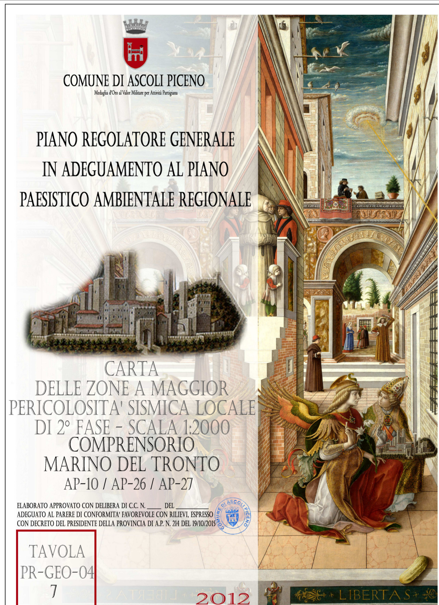
CARTE DELLE ZONE A MAGGIOR PERICOLOSITA' SISMICA LOCALE Scala 1:2.000