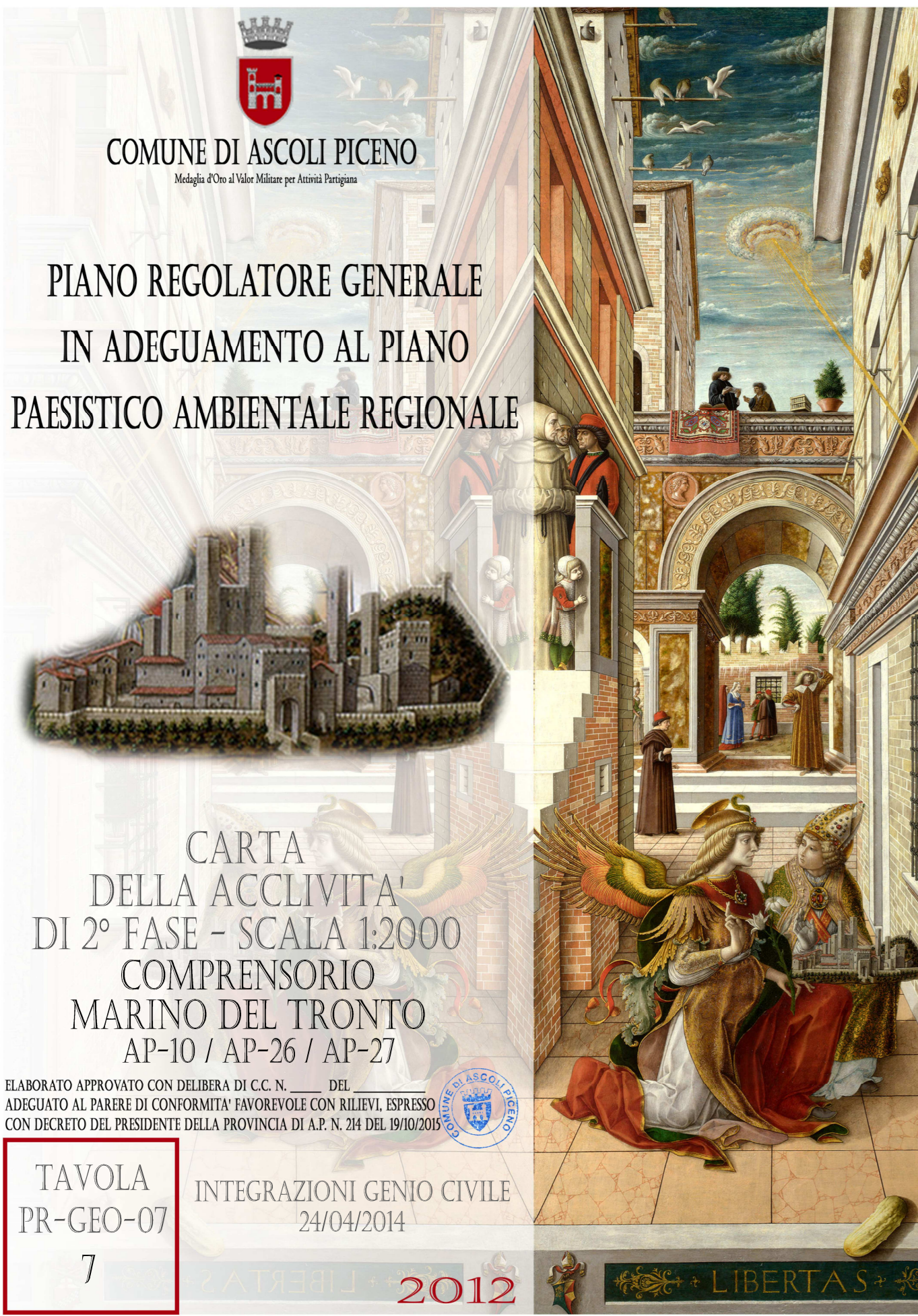
CARTA DELLA ACCLIVITA' Scala 1:2.000